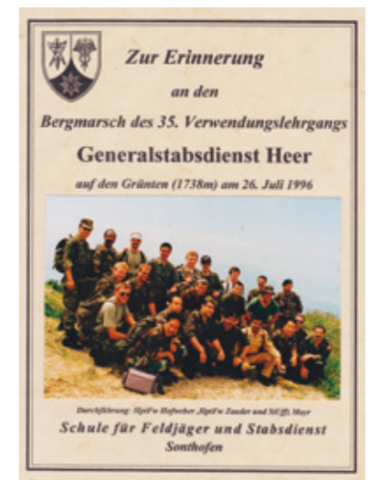
ドイツで各国学生と山登りのレクリエーション活動。