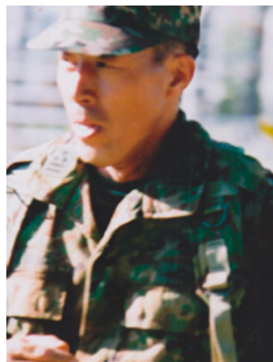
2枚とも筆者の空挺レンジャー時のもの。

これで、心身共にグリーンベレー入校の準備は整った。生憎、留学の経費は集団外旅という枠組みで、日当10ドル程度しか出ない貧乏留学だったが、陸上自衛隊に、本物の特殊部隊「特殊作戦群」を創設すべく、自分の全財産をもって米国に渡ることとなった。