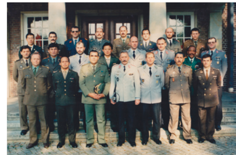
ドイツ留学時の集合写真。筆者は左上。