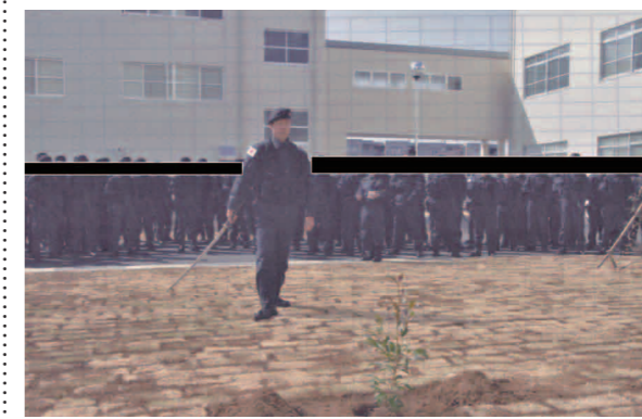
特殊作戦群の隊舎・隊員の前で植樹祭を司る筆者。

世界にあふれる光 我らの力で この歌を、特殊作戦群創設記念行事の時に全員で歌ったら、石破防衛庁長官(当時)が「自衛隊でも、遂に血を流し身を捨てる気概の部隊ができましたね」と言った。特殊作戦群隊員の覚悟を歌で察してくれた庁長官(当時)に敬服したもんだ。2004年3月29日は、日本の戦闘者の部隊が立ち上がった記念すべき瞬間だったよ。