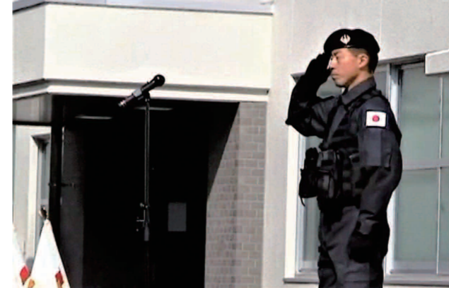
黒のタクティカルスーツに身を包んだ筆者。

感じ、死の恐怖から心を解放する。死の恐怖から解放されれば心は自由になる。思考の幅も突然広がる。心のマインド・リセットだ。